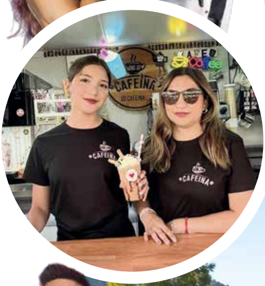
Peñaflores vivió la Fiesta Costumbrista en Fiestas Patrias, Semana Peñaflores, junto con la Fiesta del Verano y del Repollo en 2025 y 2026.