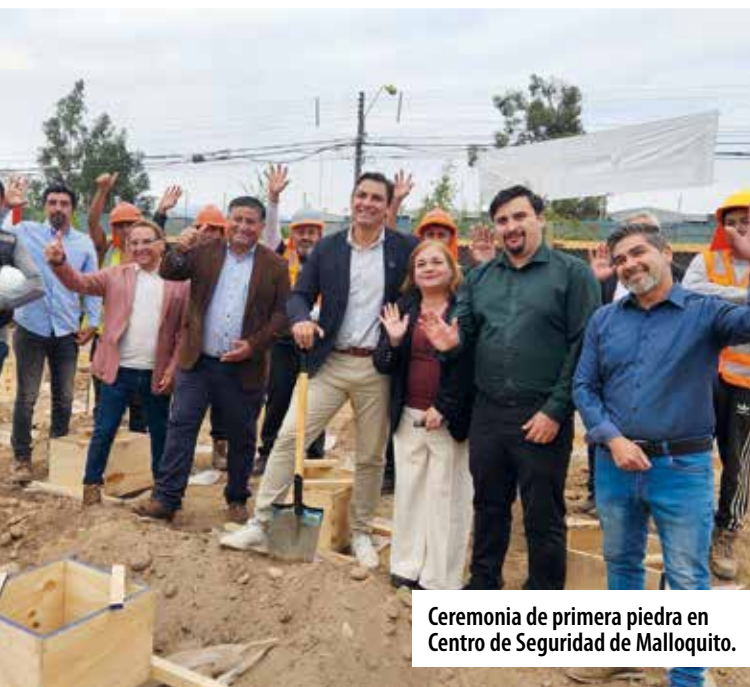
Ceremonia de primera piedra en Centro de Seguridad de Malloquito.

Rápidamente avanzan los trabajos de construcción de dos nuevos centros, ubicados en calle Malloquito y Pajaritos, que ofrecerán vigilancia y protección a los vecinos.