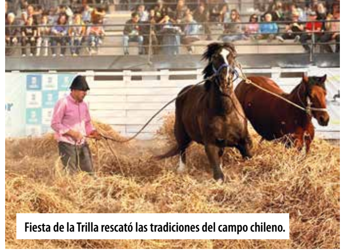
Fiesta de la Trilla rescató las tradiciones del campo chileno.

En cada una de ellas los emprendedores encontraron un espacio para fomentar su actividad económica.