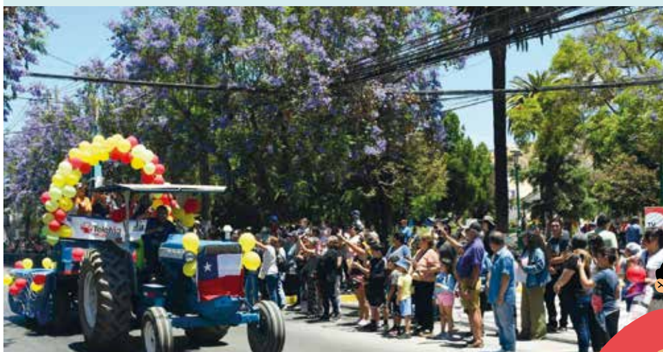
La nueva Cámara de Comercio de Peñaflor revivió la tradición de los Carros Alegóricos.