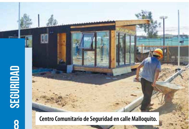
Centro Comunitario de Seguridad en calle Malloquito.

Ambos espacios contarán con personal de Peña Segura las 24 horas del día, Atención para Denuncias, Estación de Monitoreo con Video Vigilancia en tiempo real y un Centro de Distribución de Llamadas conectado a la Central de Monitoreo Municipal.