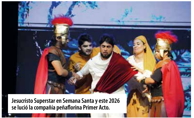
Jesucristo Superstar en Semana Santa y este 2026 se lució la compañía peñaflorina Primer Acto.