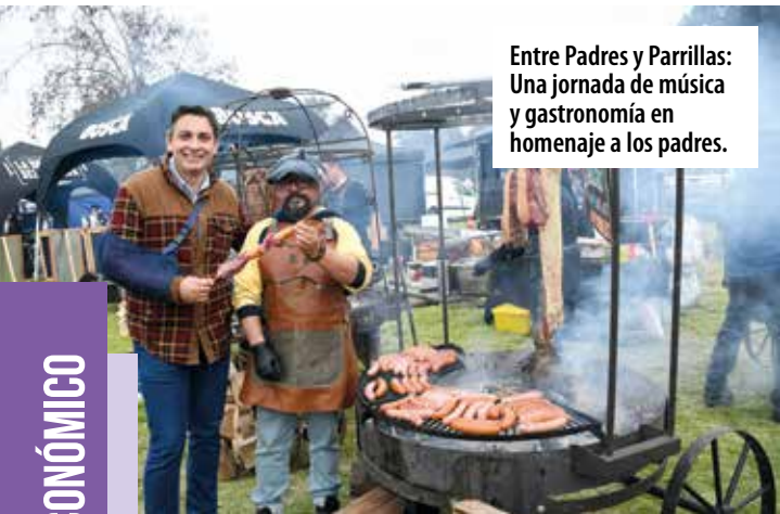
Entre Padres y Parrillas: Una jornada de música y gastronomía en homenaje a los padres.