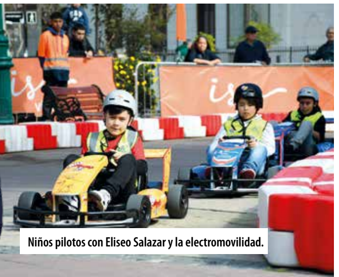
Niños pilotos con Eliseo Salazar y la electromovilidad.