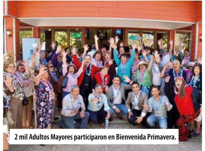
2 mil Adultos Mayores participaron en Bienvenida Primavera.