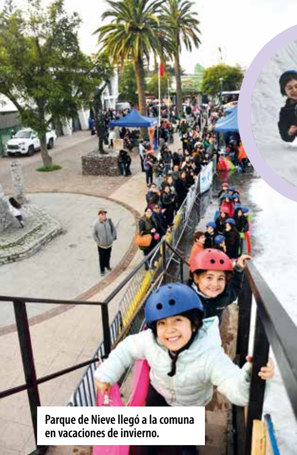
Parque de Nieve llegó a la comuna en vacaciones de invierno.